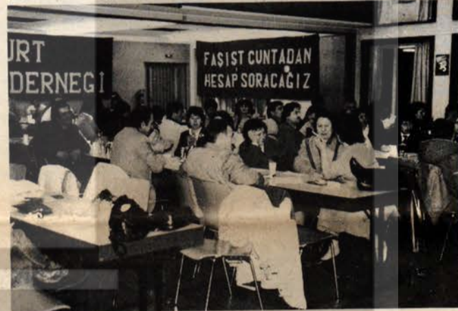
Frankfurt kutlamasından bir görünüş...

Federal Almanya'daki kadınların bir de yabancı olmaktan kaynaklanan pek çok zorluklarla karşılaştıkları dile getirilen toplantı, Türkiyeli kadınların yaşam mücadelesini konu edinen bir film gösterisi ile çoşuklu bir şekilde sona erdi.