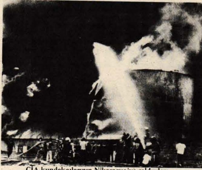
CIA kundakçılarının Nikaragua'ya saldırıları...

Grenada'nın işgalinden sonra ABD Başkanı Reagan'ın en sevdiği rüyalarından biri de, Nikaragua'nın işgali rüyası oldu. ABD halkının bu rüyayı beğenip, beğenmediği Reagan'ın pek umurunda değil. O, şimdiye kadar çeşitli yöntemler denediği halde buyruğu altına alamadığı Nikaragua'da açık eyleme geçmek arzusunda. Ve kendi deyimiyle "ülkesinin çıkarı söz konusu" olduğunda, Amerika halkının ve Kongresinin onayını almaya bilir; hatta onların ne düşündükleri de önemli değildir. Çünkü "ülke çıkarları" Reagan'ın sözlüğünde "Amerikan emperyalizminin çıkarları" anlamına gelmektedir. Bu çıkarları da Reagan ve CIA korumaktadır.