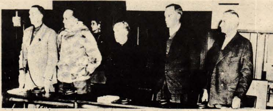
Flick 1947'de Nürnberg'te yargılanırken (en sağda)