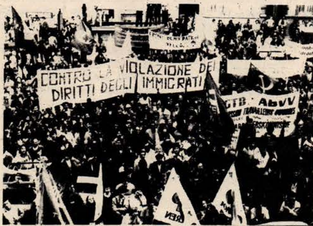
Belçika'da göçmenler yasasına karşı mitingler yapıldı.

Gazetemizin Mart sayısında sağcı partiler koalisyonu tarafından hazırlanıp, meclise sunulduğunu bildirdiğimiz yeni Belçika Yabancılar Yasası geçtiğimiz günler içinde mecliste görüşülerek onaylandı. 61 red, 18 çekimser oya karşılık 100 oyla kabul edilen tasarı yabancıların ekonomik, sosyal, kül-