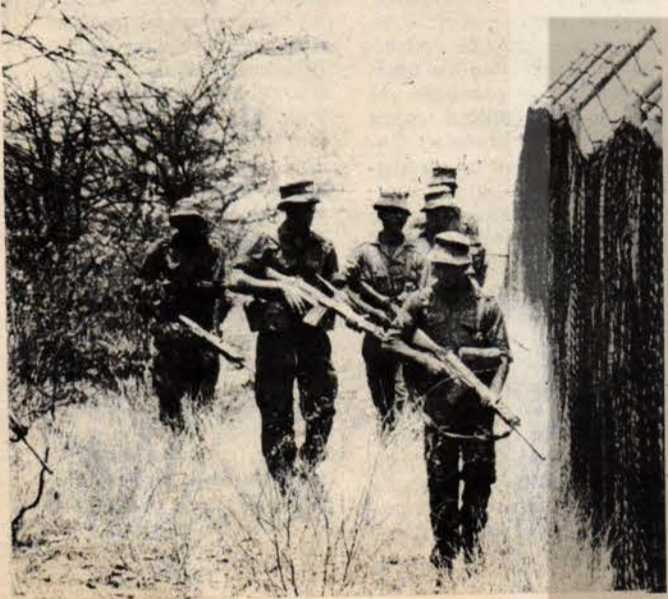
İrkçı rejimin askerleri devriyede...

Her yıl ocak ayında, ırkçı rejimin şiddetle sürdüren Güney Afrika tren istasyonları ağlayan analarla dolup taşar. Çünkü 20 bin yeni asker, birliklerine katılmak için yola çıkarlar. İyi ama analar neden ağlar? Bilindiği kadıyla Güney Afrika resmen kimseyle savaşmıyor. Ancak yıllardır "ilan edilmemiş savaşlarda" Güney Afrika milyonlarca dolar harcamakta, binlerce Güney Afrikalı ölmektedir. Son çıkan bir kanuna göre beyaz Güney Afrikalıları iki yıllık "vatan hizmeti"nden sonra her yılın dört ayını sözde "yeniden eğitim" merkezlerinde geçireceklerdir. Bu eğitim merkezleri de, ırk ayırımının bütün haşmetiyle sürdüğü bu ülkenin sınır boylarında, hatta Angola gibi komşu ülkelerin sınırları içinde bulunmaktadır.