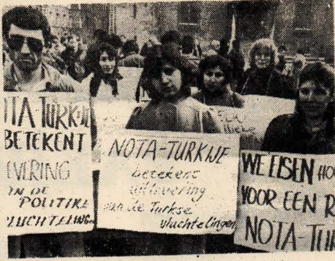
Dayanışma için Hollanda'da düzenlenen miting

Konuya değgin soruları olan emekçilerimizi yanıtlayan