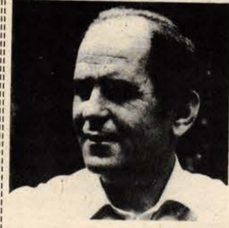
IRAZCA'NIN DİRLİĞİ KARA AHMET DESTANI (1978 Orhan Kemal Roman Ödülü)

ONUNCU KÖY KAPLUMBAGALAR AMERIKAN SARGISI TIRPAN (1970 TRT, 1971 TDK Ödülleri) EFKAR TEPESİ KEREM İLE ASLI EFENDİLİK SAVAŞI ÇİLLİ-KARIN AGRISI- CÜCE (üç kitap bir arada) ANADOLU GARAJI ON BİNLERCE KAGNI CAN PARASI (1974 Sait Faik Ödülü) KÖYGÖÇÜREN İÇERDEKİ OĞUL KEKLİK