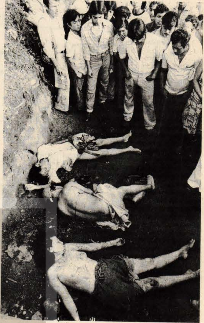
Ölüm mangalarının kurbanları...

d'Aubuisson 1979-1980 yıllarında Guatemala ile El Salvador arasında mekik dokuyor, düzenli olarak küçük bir grup zengin El Salvador'lularla buluşuyordu. Bu zengin sürgünler, hükümetin çıkardığı yasaları bile beğenmiyorlar ve El Salvador'da sadece kendi sözlerinin geçmesini istiyorlardı. Öldürülmesini istedikleri kimselerin isimlerini d'Aubuisson'a söylüyorlar ve ölüm mangalarının parasını da veriyorlardı. İsimleri alan d'Aubuisson, savunma bakanı ve mali polis şefi ile buluşuyor, birlikte -potansiyel bile olsa- sola sempati duyanların listesi yapıyor, ölüm mangaları da harekete geçerek, bu kişileri katlediyorlardı. Bu zenginler daha sonra ABD'nin Miami eyaletine yerleştirilmişler, ancak ölüm mangaları ile ilişkilerinde herhangi bir değişiklik olmamıştı. Mali polis şefi Albay Carranza mangaların hükümet içindeki en büyük yardımcıydı. Diğer generaller ve yüksek hükümet yetkilileri de cinayetlerin örtbas edilmesinde önemli rol oynuyorlardı. Yeni savunma bakanı General Eugenio Casanova cinayet dosyalarının ka-