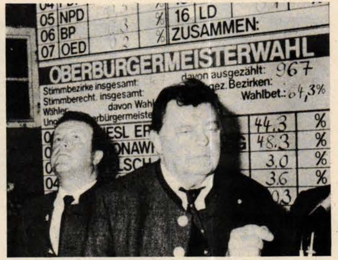
Strauss kendi kalesinde kaybettii...

İşyeri temsilciliği seçimlerinde biz Türkiye'li emekçilere düşen görev gerek DGB'nin karşısındaki, işverenlerden yana, gerici Hristiyan Sendikalar Birliğinin (CGB) ve onun metal işkolunda olan (Hristiyan Metal Birliği'nin) (MV) adayları arasında yer almamak ve onların listelerine kesinlikle oy vermemektir. Diğer yandan yine bu sendikaların ve işverenlerin bir taktığı olan sözde "DGB sendikalarından 'bağımsız' ya da 'özgür' listeler" adı altında çıkarılan adaylara karşı uyanık olmak ve bu listelere oy vermemektir. Unutmayalım ki; işyeri temsilciliği seçimleri, sendikal mücadele ile birleştirilmediğinde, yerli ve yabancı işçiler sendikalarından ketenlenmeyince ekonomik mücadele açısından güdük kalmaya mahkumdur. Yapılması gerekli bu seçimlerde DGB sendikalarının adayları safında yer alırken 35 saatlik iş haftası mücadelesi olmak üzere ekonomik demokratik mücadelenin her alanındaki başarısı için DGB sendikalarında örgütlenmektir.